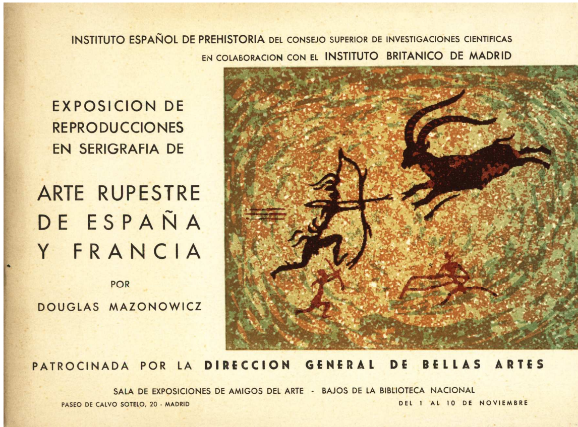
Figura 4 Portada del catálogo de la exposición

Les Combarelles. La mayoría de las obras costaban entre 2.000 y 3.500 pesetas (Figura 4).