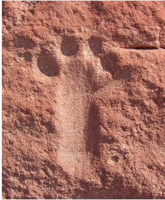
Figura 8 Pisada humana, abradado, Grupo 2