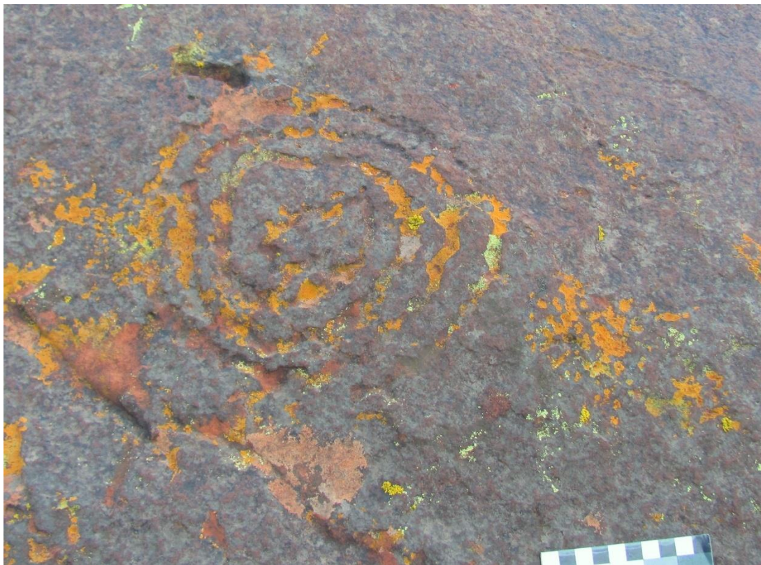
Figura 9 Motivos de espiral y de óvalos unidos, técnica de picado regular discontinuo, Grupo 1 (Los Colorados)

Otro de los temas que se evaluó es la ubicación y la relación del arte rupestre respecto de otras evidencias arqueológicas. En las tres localidades el posicionamiento del arte rupestre en los soportes es visible y en espacios abiertos. Como se dijo, en Palancho, donde no se han identificado otras evidencias además de los grabados rupestres, se han registrado representaciones de varios metros de altura en las que se privilegia la visibilidad. En Los Colorados la distribución de las representaciones en el paisaje tiene la particularidad de ser más dispersa y discontinua (Figura 10). Palancho se presenta como un conjunto de múltiples superposiciones y, en algunos casos, de reutilización de los soportes hasta su completa cobertura; mientras que en Los Colorados solamente se señalan los extremos de los afloramientos con pocas representaciones. En El Chiflón-Punta de la Greda solamente un bloque con la representación de dos líneas almenadas está asociado a una estructura circular de piedra. En esta última localidad no se ha relevado arte rupestre ni en los conjuntos de estructuras de altura (Pucaras El Chiflón y Tortuga), asociado a estructuras fijas de molienda o en los aleros con material lítico y cerámico disperso en superficie. Las representaciones nunca están asociadas a cursos de agua o manantiales.