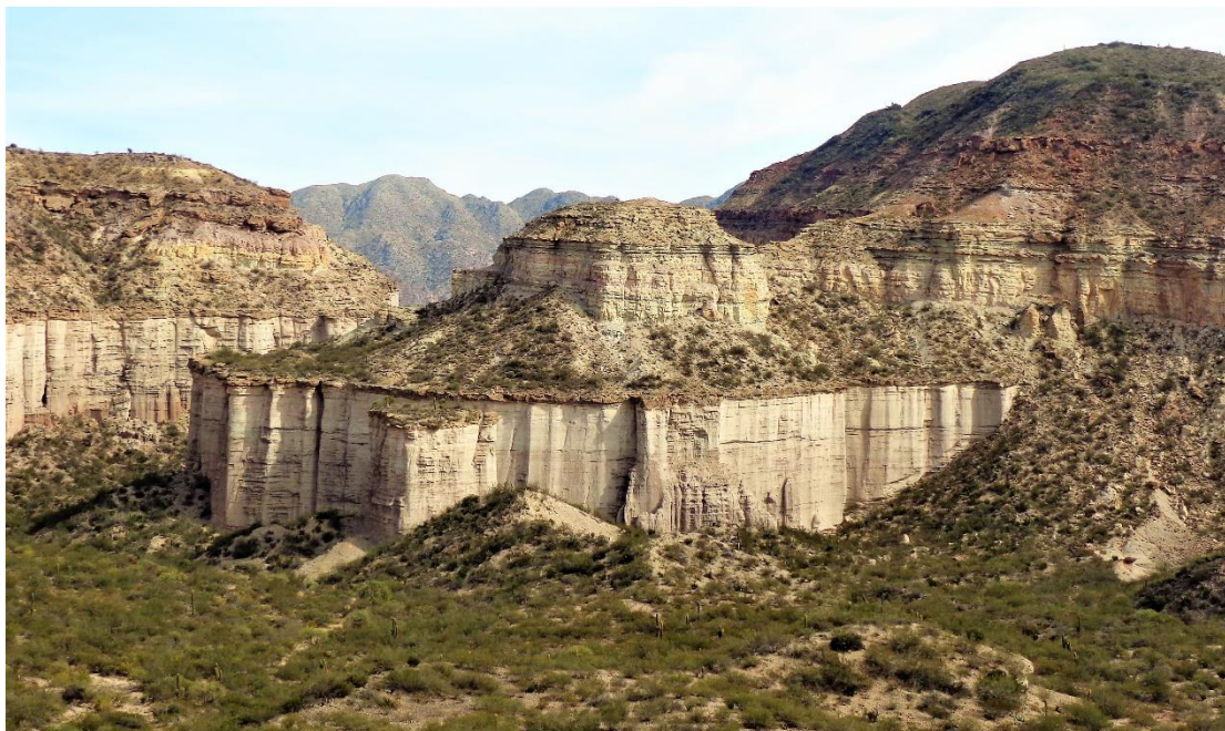
Figura 3 Cerro Tortuga (El Chiflón- Punta de la Greda)

Los fechados del Pucará El Chiflón participan de dos momentos diferentes. Un momento que correspondería con el Período de Integración Regional y, otro momento más tardío que señalaría la transición entre este período y el de los Desarrollos Regionales. De la capa 2 de ChiE25E se obtuvo un fechado de 1100 \pm 60 años AP (LP-2685) (Rango cal AD 940- AD 1034). Por su parte, el recinto ChiE1 tuvo un fechado de 1280 \pm 50 años AP (LP 2678) (cal AD 768: AD 879). Asimismo en Loma Vigía, sector bajo en frente al Pucará el Chiflón se han obtenido sobre carbón vegetal dos fechados de 770 \pm 50 años AP (LP 3341) (cal AD. 1259: AD 1375); y 780 \pm 50 (LP 3331) (cal AD 1226: AD 1296) 23 . Estos fechados se vincularían con los obtenidos en Los Colorados (ver más adelante), indicando una reutilización del espacio y de posibles relaciones logísticas entre las localidades comparadas (Tabla 1). En este contexto, El Chiflón se destaca por ser la única localidad con evidencias (conjuntos de recintos habitacionales en altura y recintos dispersos en las zonas bajas) de una cierta concentración poblacional 24 (Figura 3). Cabe aclarar que en El Chiflón no se han registrado construcciones de que puedan ser interpretadas como corrales ni como andenes o terrazas de cultivo.