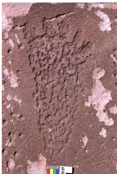
Figura 7 Pisada humana, picado regular discontinuo, Grupo 1

Al mismo tiempo se consideraron los tipos (figura humana, zoomorfo, línea, etc.), identificando en total 20 tipos figurativos y 35 tipos abstractos asignados al PIR y al PDR, es lo que se ha definido como repertorio iconográfico. Es notable la poca variabilidad tipológica teniendo una muestra tan numerosa (1948 representaciones), este hecho es lo que permite proponer que se trata de espacios utilizados por comunidades con códigos visuales compartidos con recurrencia de motivos a lo largo del tiempo. Esto puede ejemplificarse con la representación de un motivo: la pisada humana. Se identifica con diferentes técnicas y pátinas en los Grupos 1, 2 y 3 (Figuras 7 y 8) 36 . Por este motivo se considera que el motivo continuó vigente a lo largo del tiempo adecuándose a los diferentes “estilos” de representación (Tabla 3).