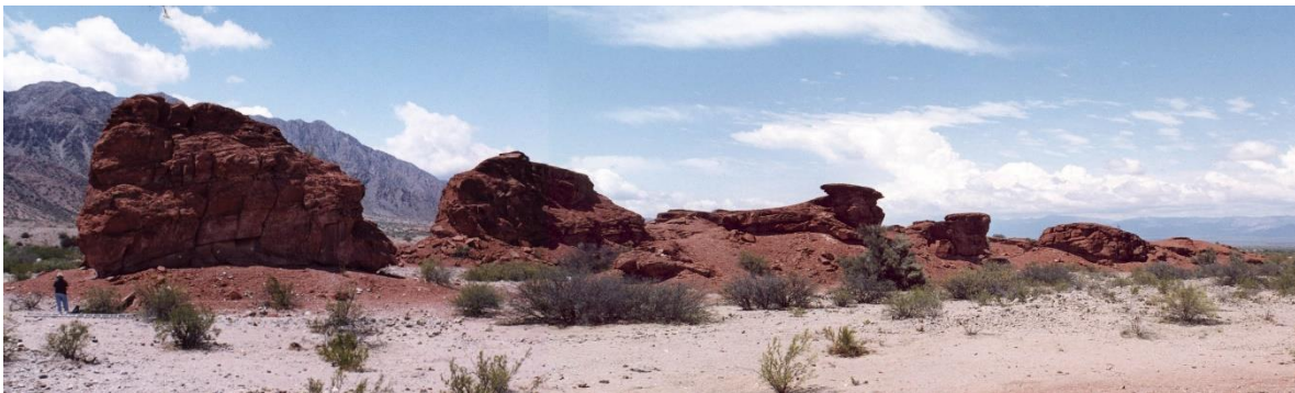
Figura 4 Afloramientos de arenisca en Palancho

Uno de los rasgos más destacados de la localidad es su reutilización durante un extenso rango temporal (aprox. desde los AD 600 hasta momentos históricos) que estaría señalando a Palancho como hito en el espacio regional a lo largo del tiempo. El carácter de tipo público de las representaciones y su monumentalidad le otorgan un carácter único. La aridez del lugar así como la ausencia de otras evidencias arqueológicas conducen a proponer que su función estuvo restringida a la ejecución y uso de arte rupestre.