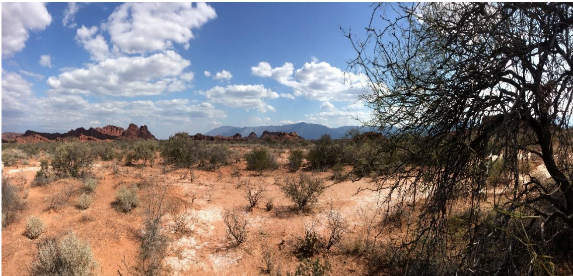
Figura 2 Vista del ambiente desértico en Los Colorados